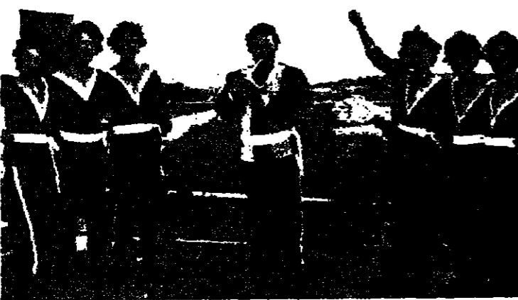
فرقة الرقص الشعبي للصغار في دالية الكرمل